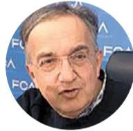
Sergio Marchionne, CEO de FCA.

“Esas plantas se pueden cerrar en caso de que el TLC (sea renegociado)... son riesgos que se tomaron Brasil y México...”