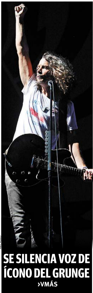
SE SILENCIA VOZ DE ÍCONO DEL GRUNGE VMÁS